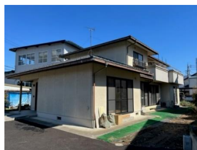
リアン松岡の外観

15 年の間には言葉に表せないほどたくさんの思い出があり、懐かしさと時の流れを感じます。新たなグループホームの名称ですが、リアンの名前を残したいというみんなの思いから「リアン松岡」に決まりました。サンマリンながのに近い閑静な住宅地で、男性 5 名が入居します。入居前に見学した利用者からは「建物の感じがリアンと似ている」、「また(庭の片隅で)畑はできますかね」といった感想が聞かれました。