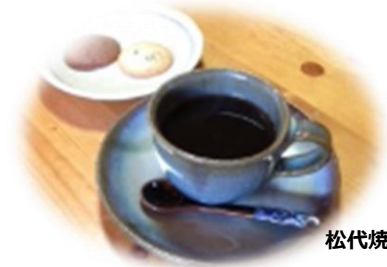
松代焼のティカップでおもてなし