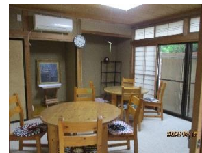
多目的に使用できる部屋