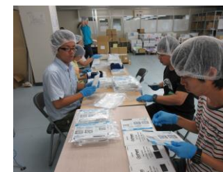
<施設外作業の様子>