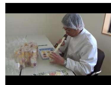
<ゼリー詰め作業の様子>