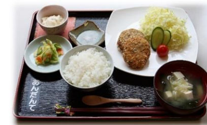
定番人気メニュー 豆まめコロッケ定食