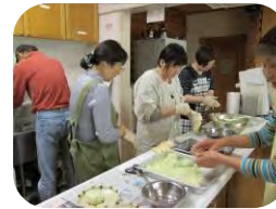
作って食べようお昼ごはん

☆生活習慣病についての理解を深める学習会や、健康的な生活の基礎をつくるための運動をプログラムに取り入れています