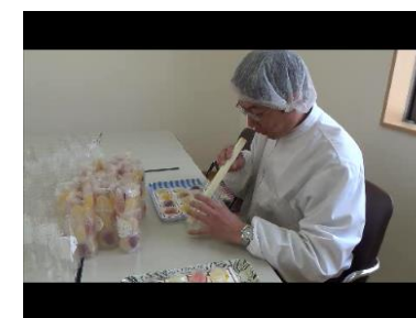
<ゼリー詰め作業の様子>